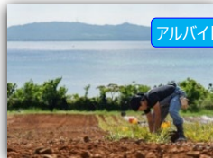
アルバイト受入れ先例：農家